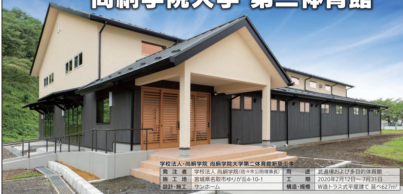
学校法人・尚綱学院 尚綱学院大学第二体育館新築工事