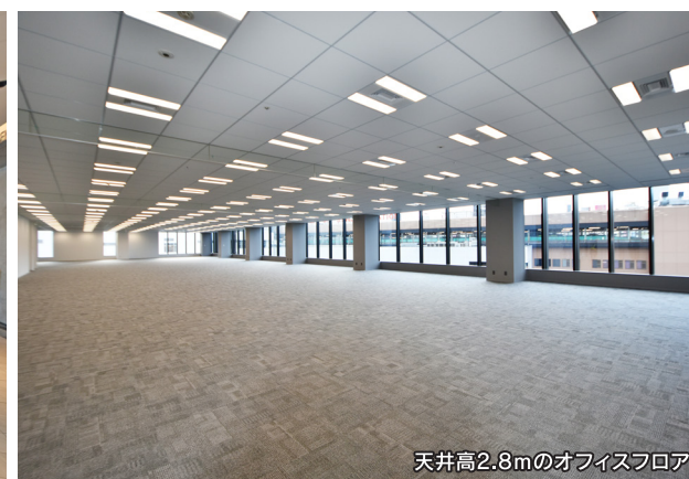
天井高2.8mのオフィスフロア