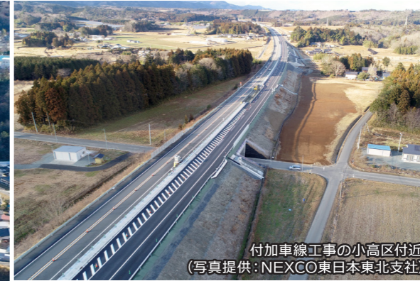
付加車線工事の小高区付近