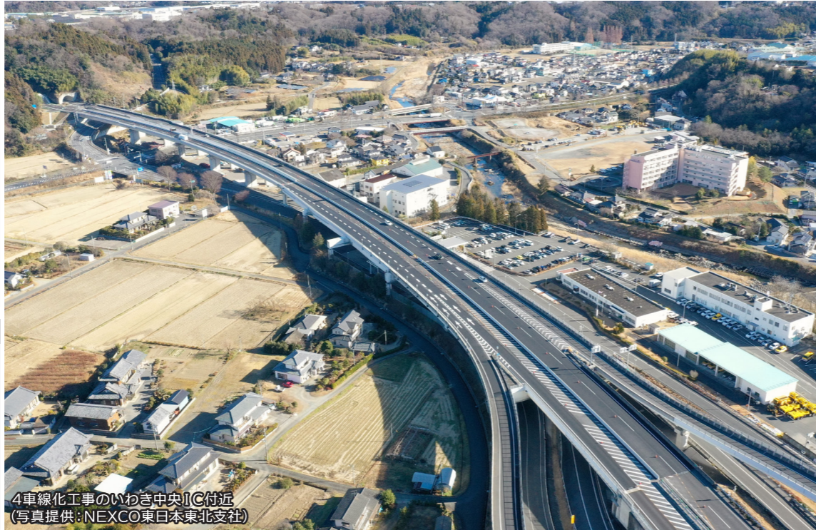
4車線化工事のいわき中央IC付近

東京都中央区佃2丁目1-6 TEL.03(4582)3131 FAX.03(4582)3236