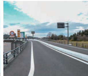
上下線への接続道路

岩手県平泉町とNEXCO東日本東北支社北上管理事務所が共に整備を進めてきた東北自動車道「平泉スマートインターチェンジ」が12月4日に開通した。同スマートICは、一関IC~平泉前沢ICの間に設けられ、世界遺産「平泉の文化遺産」や高田前工業団地にも近いことから、アクセスの向上により、地域の観光振興や物流効率化に大きく寄与することが期待される。