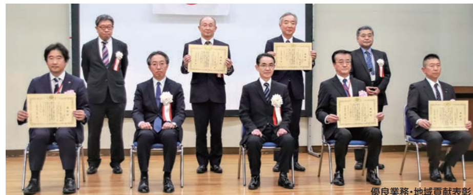
優良業務・地域貢献表彰