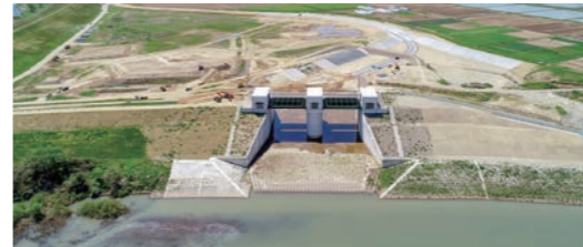
一関遊水地 第1遊水地 大林水門周辺

ていく必要があります。岩手山も1989年以降に火山活動が活発化していて、現在は落ち着いているものの今後いつ急変するか分かりませんので、危機感を持って事業の推進に取り組んでいきたいと思っています。