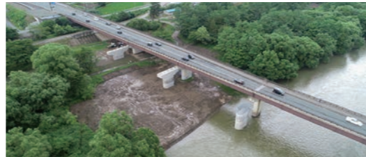
国道46号盛岡西BP 西大橋下部工