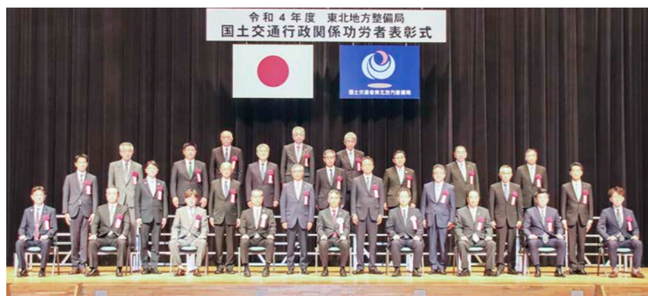
令和4年度 東北地方整備局 国土交通行政関係功労者表彰式