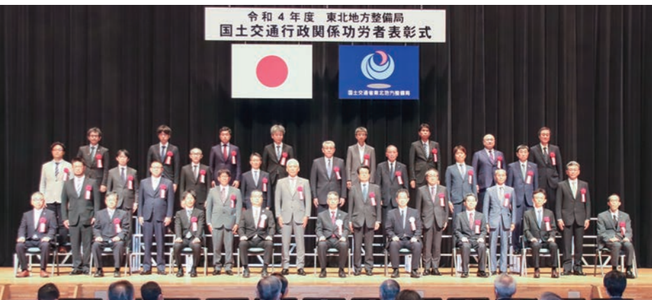
令和4年度 東北地方整備局 国土交通行政関係功労者表彰式