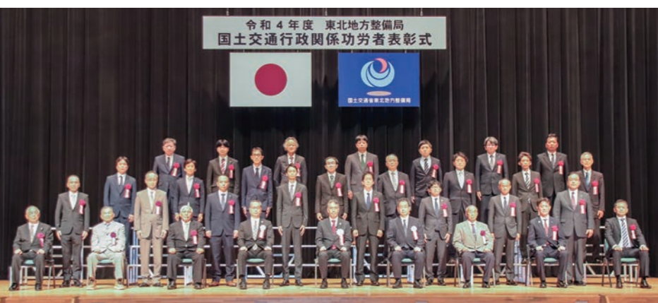
令和4年度 東北地方整備局 国土交通行政関係功労者表彰式