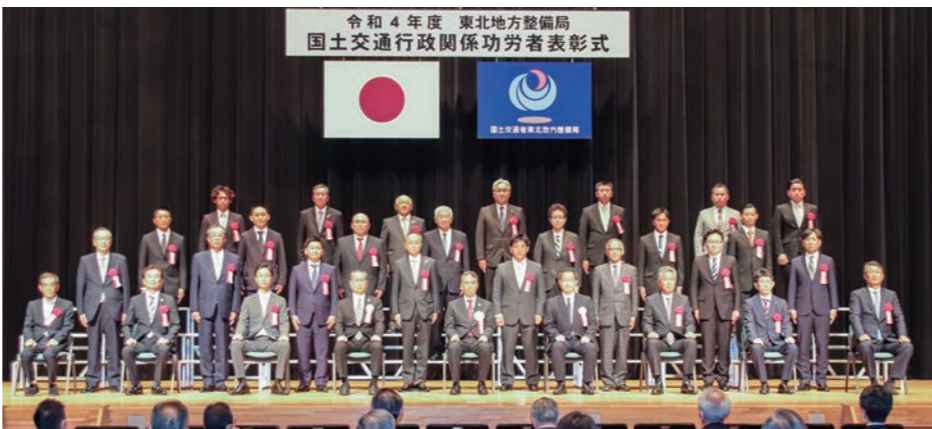
令和4年度 東北地方整備局 国土交通行政関係功労者表彰式