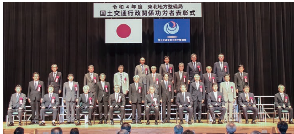
令和4年度 東北地方整備局 国土交通行政関係功労者表彰式

最後に、皆さまのご健勝とますますのご活躍を心からご祈念申し上げ、あいさつとさせていただきます。