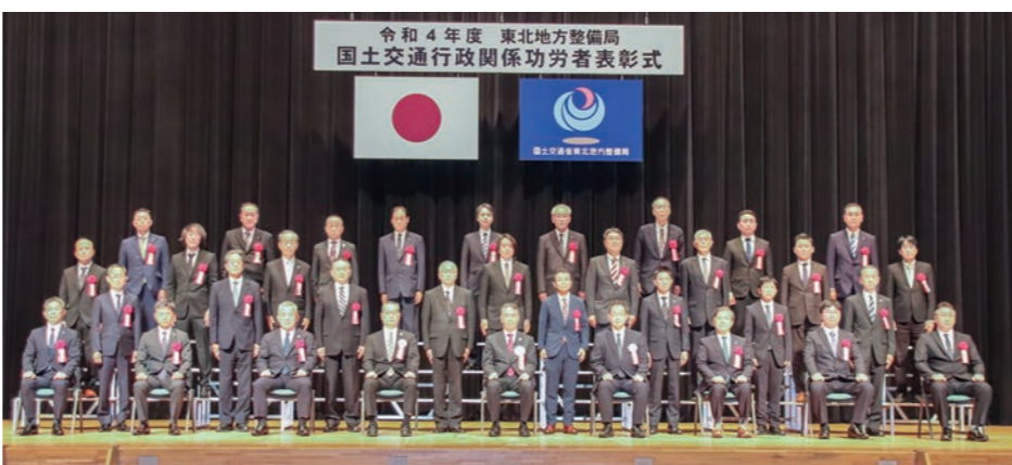
令和4年度 東北地方整備局 国土交通行政関係功労者表彰式