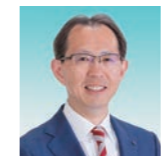
福島県知事 内堀 雅雄