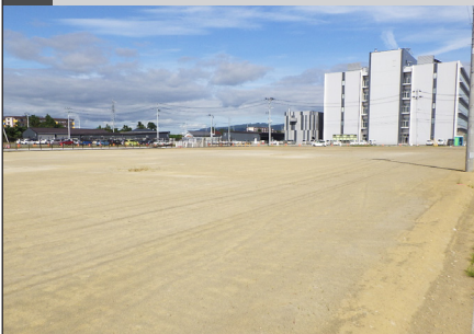
(継)令和2年度 柳の目地区産業用地(北工区宅地)造成工事

(継)令和2年度 柳の目地区産業用地(北工区宅地)造成工事 令和4年度 道路メンテナンス事業 定川新橋外1橋梁補修工事