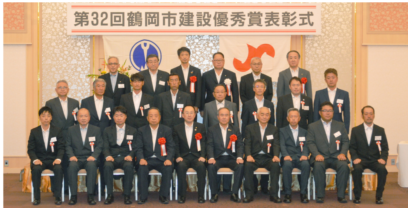
第32回鶴岡市建設優秀賞表彰式

鶴岡市建設優秀賞は、鶴岡商工会議所建設工業部会が建設業の魅力アップ、人材育成および確保、技術の向上などを目的に、毎年第一線で活躍する優秀な建設技術者等を表彰するもの。市発注の工事のほか民間工事も対象とし、今回は市長賞に9人、商工会議所会頭賞に4人および4社が選ばれた。