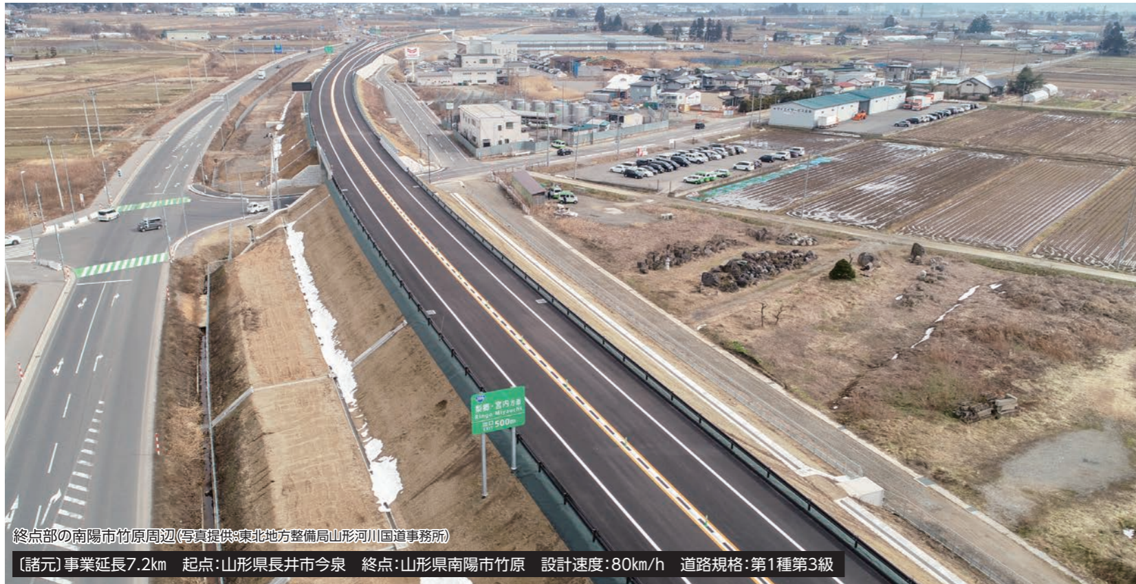
終点部の南陽市竹原周辺

(諸元)事業延長7.2km 起点:山形県長井市今泉 終点:山形県南陽市竹原 設計速度:80km/h 道路規格:第1種第3級