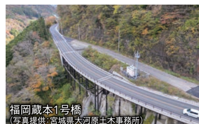
福岡蔵本1号橋

今回の全線開通により、物流上重要な道路輸送網としての機能強化だけでなく、災害発生時には第1次緊急輸送道路である東北縦貫自動車道や国道4号との連絡強化が図られ、緊急輸送ネットワーク機能の向上が期待される。