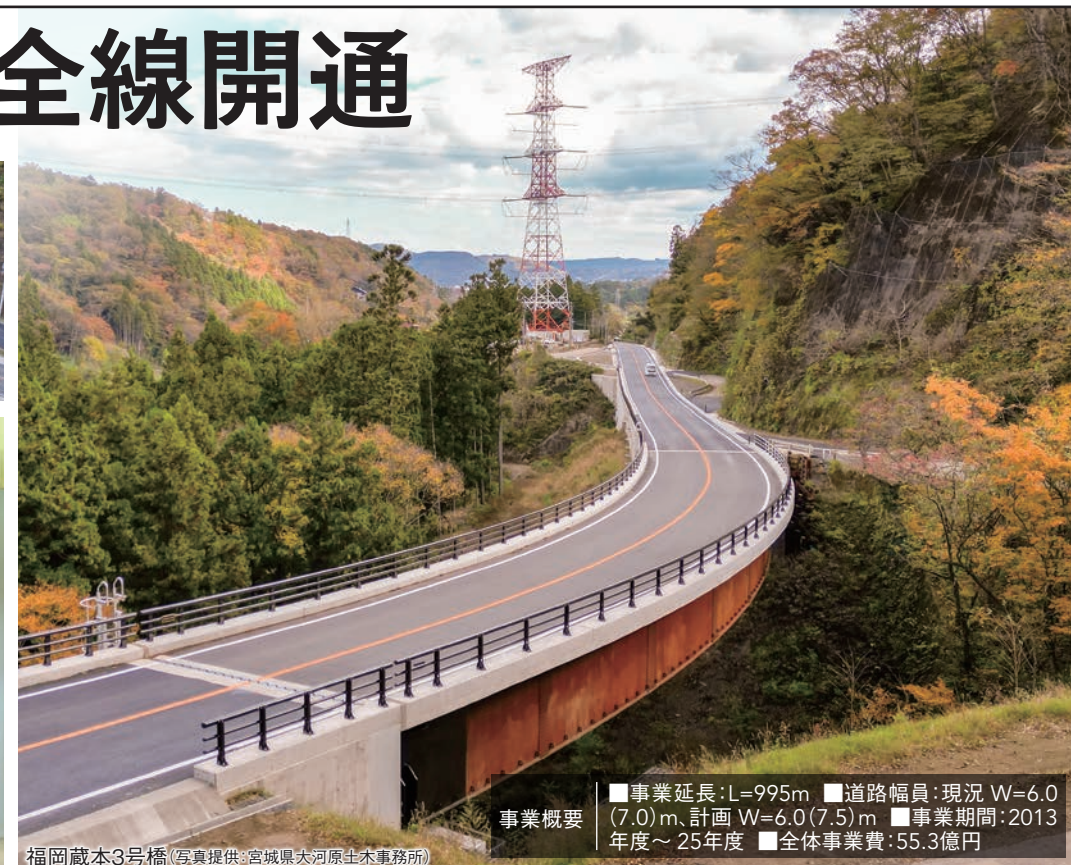
福岡蔵本3号橋

事業概要 ■事業延長:L=995m ■道路幅員:現況 W=6.0(7.0)m、計画 W=6.0(7.5)m ■事業期間:2013年度～25年度 ■全体事業費:55.3億円