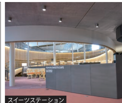
スイーツステーション